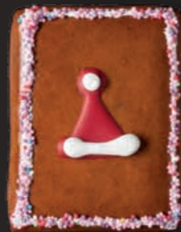
Biber Chlaus (klein)