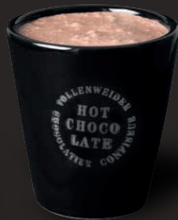
Hot Chocolate Tasse