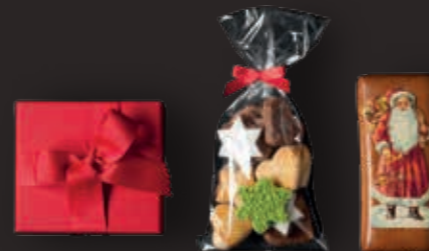
Inhalt St. Moritz und Gstaad

Gstaad – Wool Blend & Samtband Hand Made und Swiss Made, CHF 88.00