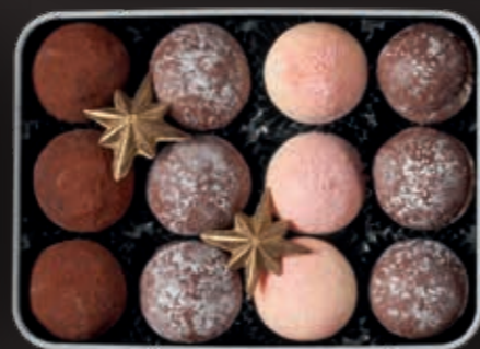
Christmas Star, gold