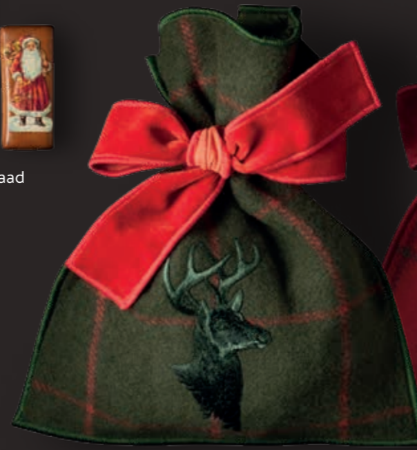
St. Moritz, hunter green