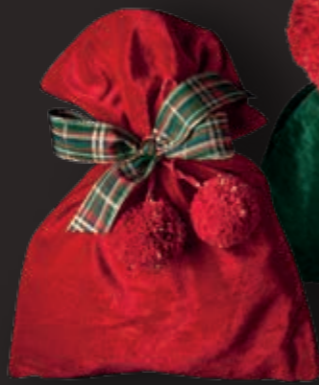
Papa Noël, bordeaux