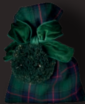
Royal Stewart, hunter green