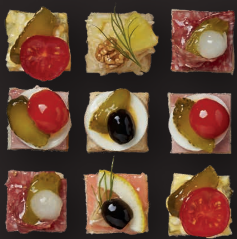
Canapés Bio-Schinken (CH) Ei (CH, Freiland) Sellerie Thon Lachs (Lostallo, CH) CHF 3.00 / Stk