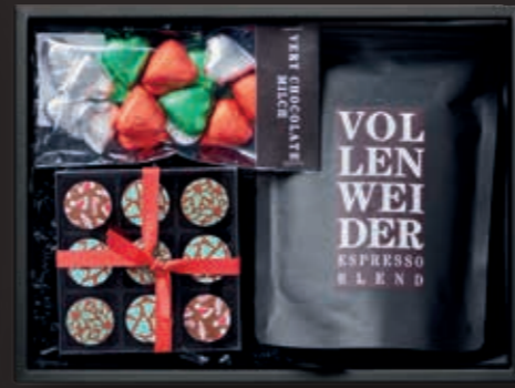
Coffee & Chocolate Lovers Unite