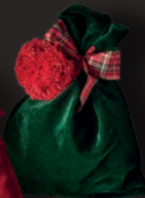
Papa Noël, vert

Royal Stewart, alle Farben Hand Made und Swiss Made, 100g Schokoladeherzli, Biber, Weihnachtskonfekt CHF 47.00