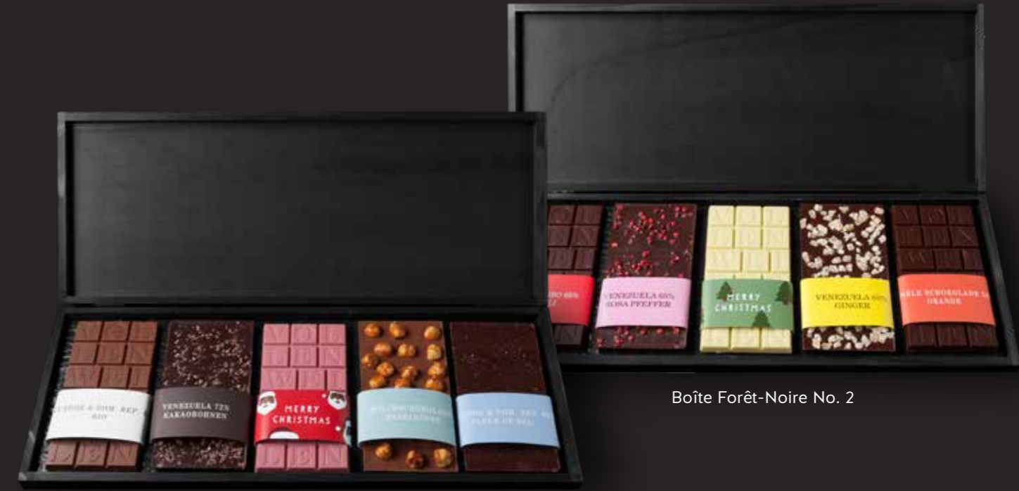
Boîte Forêt-Noire No. 1

Boîte Forêt-Noire 5 Schokoladetafeln in einer edlen Holzboîte No. 1: CHF 73.00 No. 2: CHF 77.00