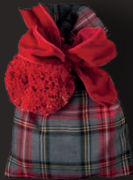
Royal Stewart, grey