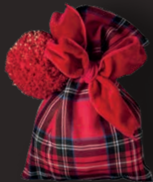
Royal Stewart, red