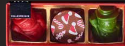
3er Pralinés / Truffles Stange