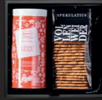
Tea & Cookies