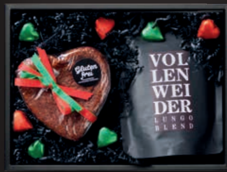
Kaffee & Kuchen